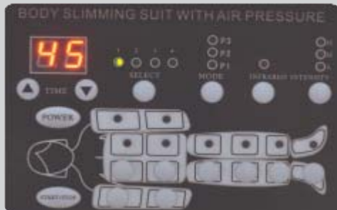
Software muy seguro e intuitivo

La novedosa combinación de prestoterapia junto con infrarrojos facilita la circulación sanguínea además de estimular la producción de colágeno, e incrementando la actividad celular para dar consistencia a los tejidos.